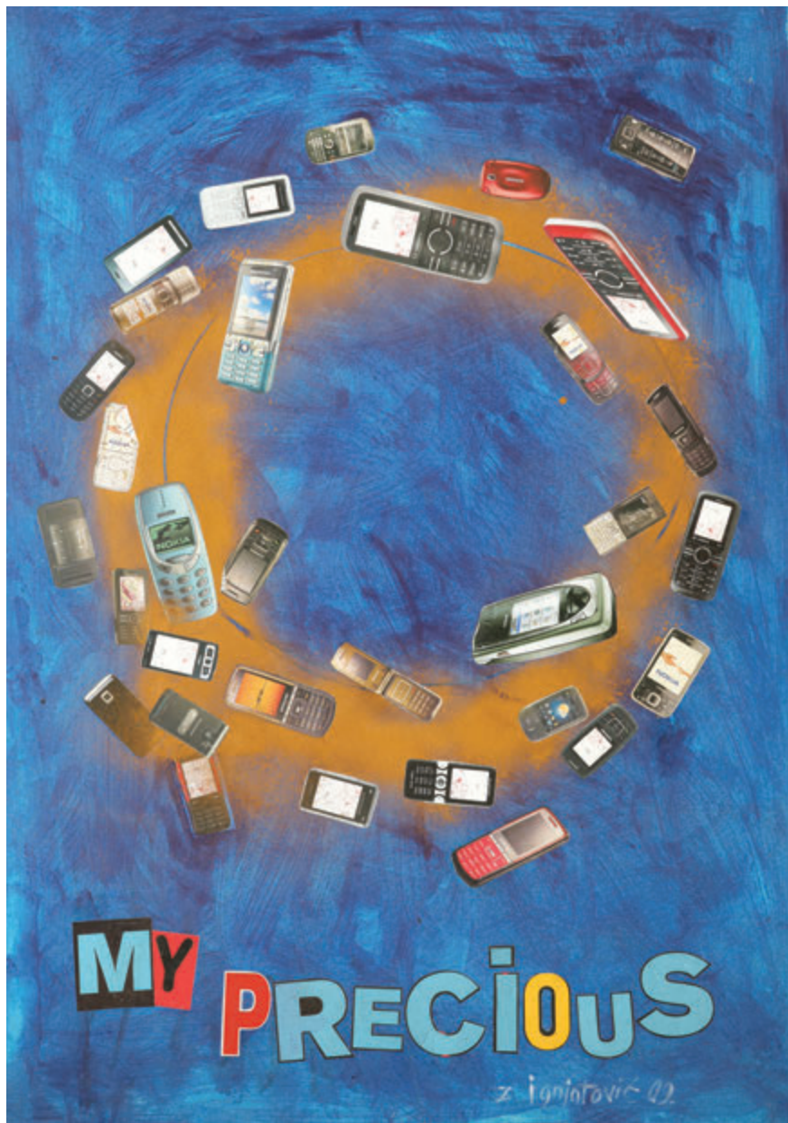
My Precious 70x50 cm - kolaž, 1999.