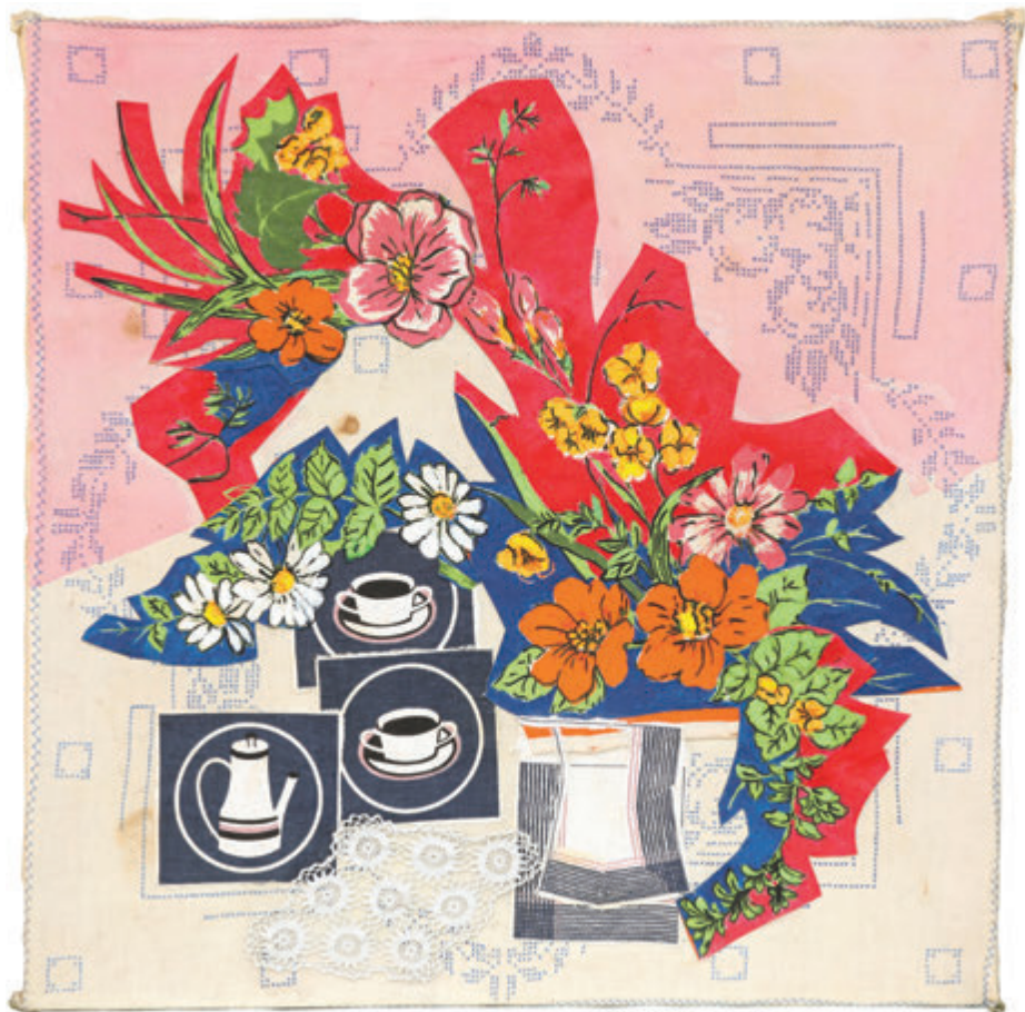
Kafa jutarnja 75x75 cm - kombinovani materijali, 2006.