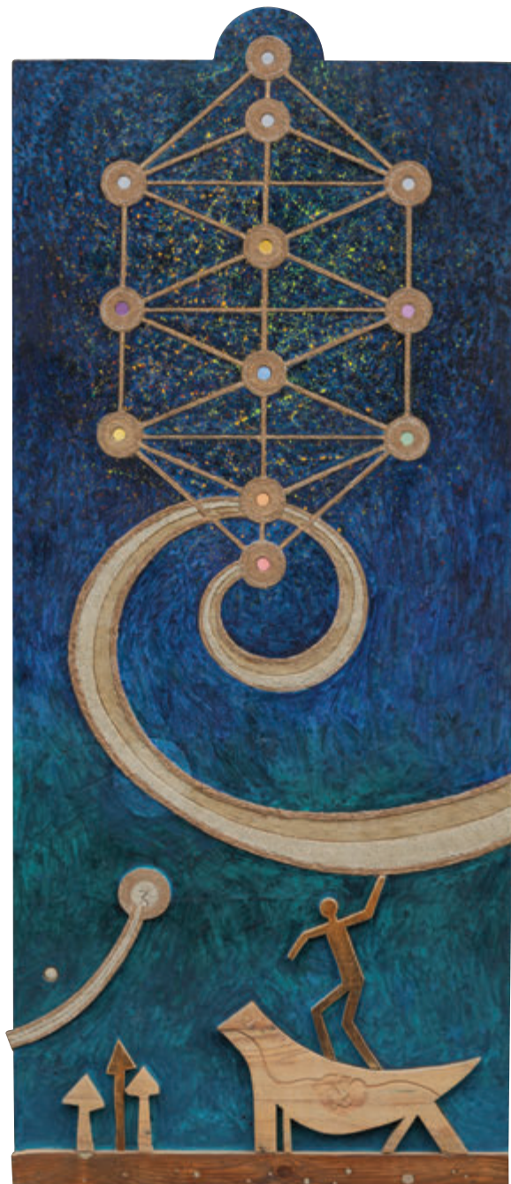
Vrata 189x81cm - kombinovani materijali, 2018.