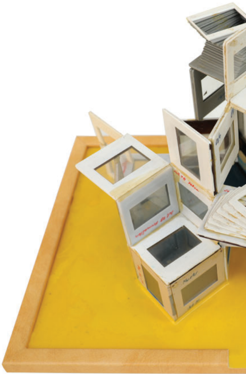
Nacrt za muzej uspomena 35,5x45,5x22 cm - kombinovani materijali, 2015.