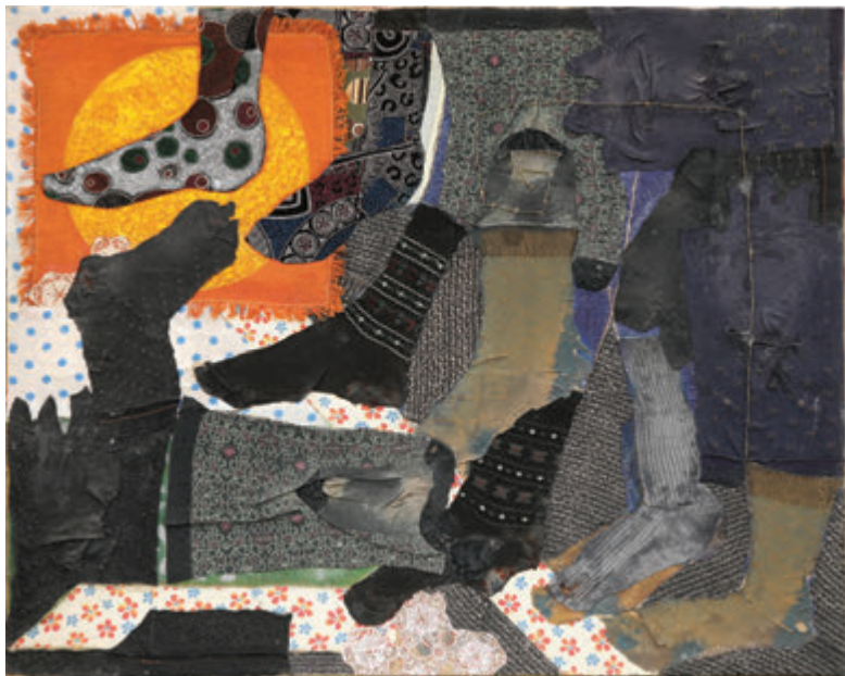
Princ 48,5x68 cm - kombinovana tehnika, 2010.