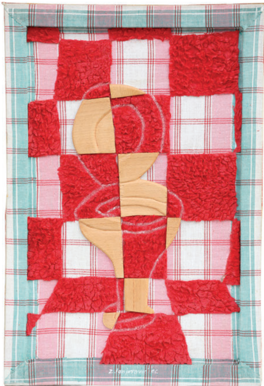
Šolja II 55x37 cm - kombinovani materijali, 2006.