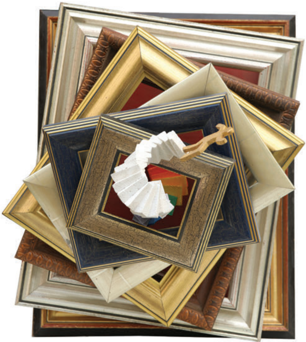
Skok 49x42x42 cm - bojeno drvo, 2018.