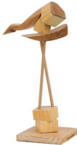
Stepenice 37x13x19 cm - kombinovani materijali, 2017.