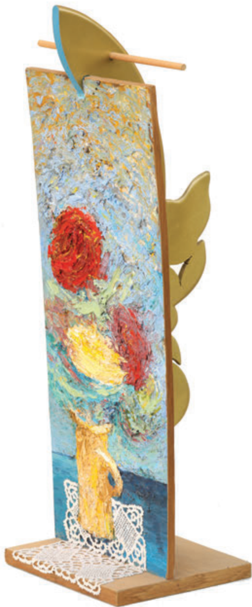
B-side 69x24x26,5 cm - kombinovani materijali, 2017.