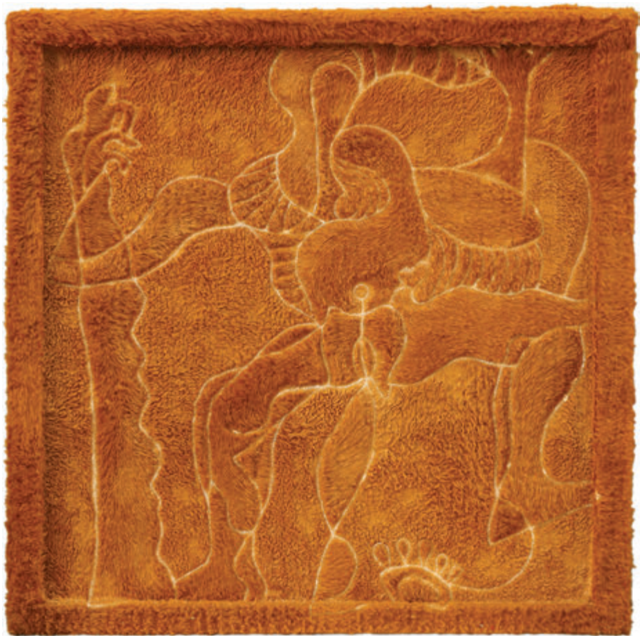
Igra 102x102 cm - kombinovani materijali, 2006.