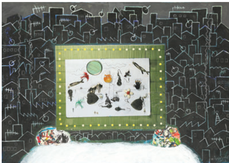
Razglednica iz mog okruza 45x55 cm - akril, ulje, 2018. Svetleća reklama 48x67,5 cm - kolaž, 2012.