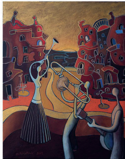
On The Corner, 50 x 40 cm, akrilik na platnu, 2017.