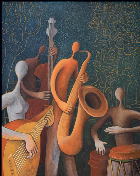
Slow Change , 100 x 80 cm, akrilik na platnu, 2018.