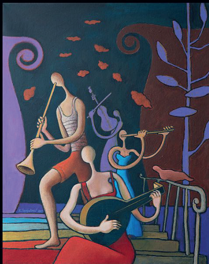
Internal Stairway, 50 x 40 cm, akrilik na platnu, 2017.

Zoran Ignjatović je započeo svoju umetničku odiseju na Akademiji likovnih umetnosti u Sarajevu. Već tokom studiranja priredio je prvu samostalnu izložbu i od tada se može pratiti njegovo kontinuirano bavljenje slikarstvom. On svoju životnu pasiju, muziku, otelotvoruje u umetničkom opusu kroz pojavnu datost kao plastično najčitljiviji aspekt dela.