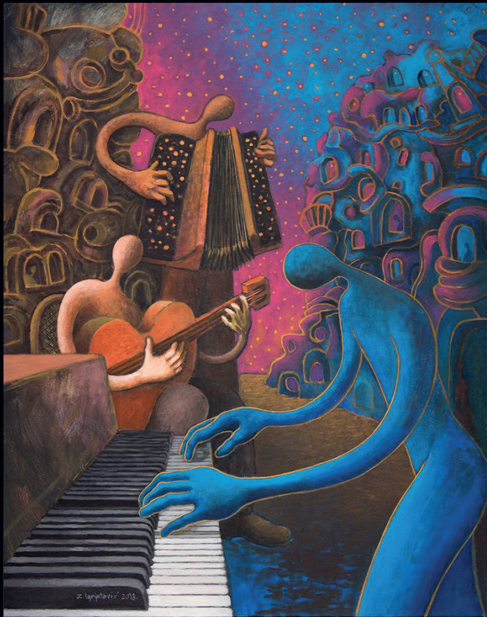
New Morning , 100 x 80 cm, akrilik na platnu, 2018.