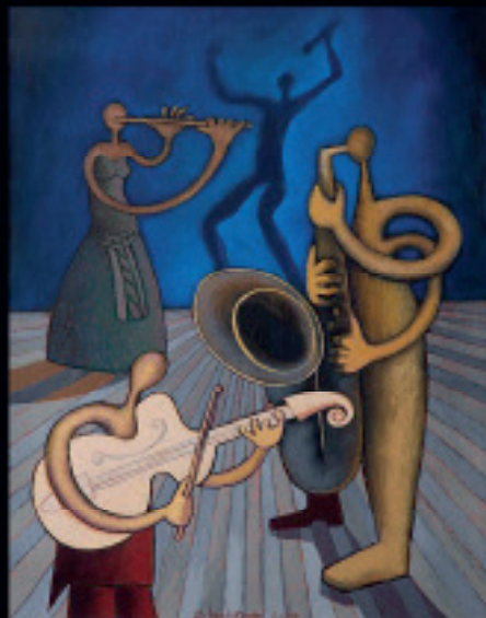
Jazz Singer, 50 x 35 cm, akrilik na platnu, 2017.