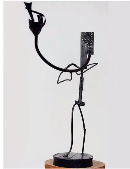
Maestro , metal, visina 72 cm, 2016.