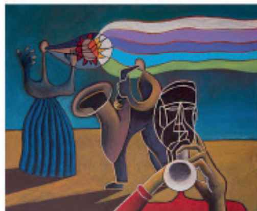
Seleni Husek, 45 x 55 cm, akrilik na platnu, 2017.