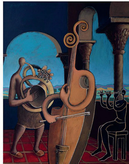
In My Palace , 55 x 45 cm, akrilik na platnu, 2017.