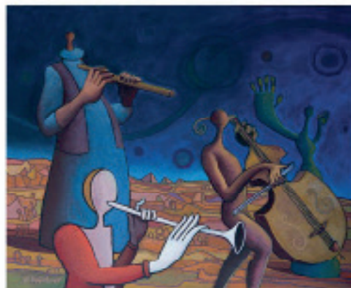
On The Road, 45 x 55 cm, akrilik na platnu, 2017.