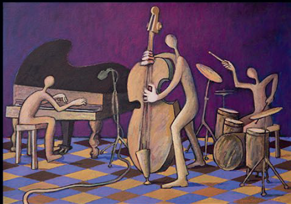
Lars Danielsson Trio, 35 x 50 cm, akrilik na platnu, 2017.