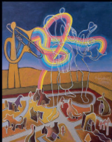
Somewhere Over The Rainbow, 50 x 40 cm, akrilik na platnu, 2018.