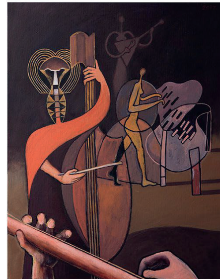
Nocturne , 55 x 45 cm, akrilik na platnu, 2017.