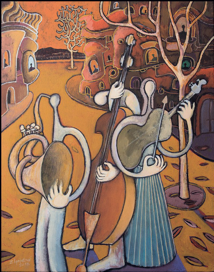
Love Song, 50 x 40 cm, akrilik na platnu, 2018.