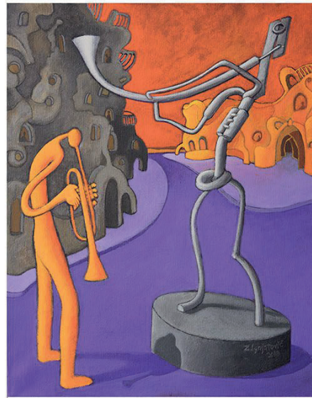
Miles Smiles , 50 x 40 cm, akrilik na platnu, 2018.