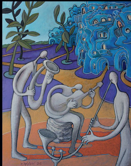
The Blue City , 50 x 40 cm, akrilik na platnu, 2018.